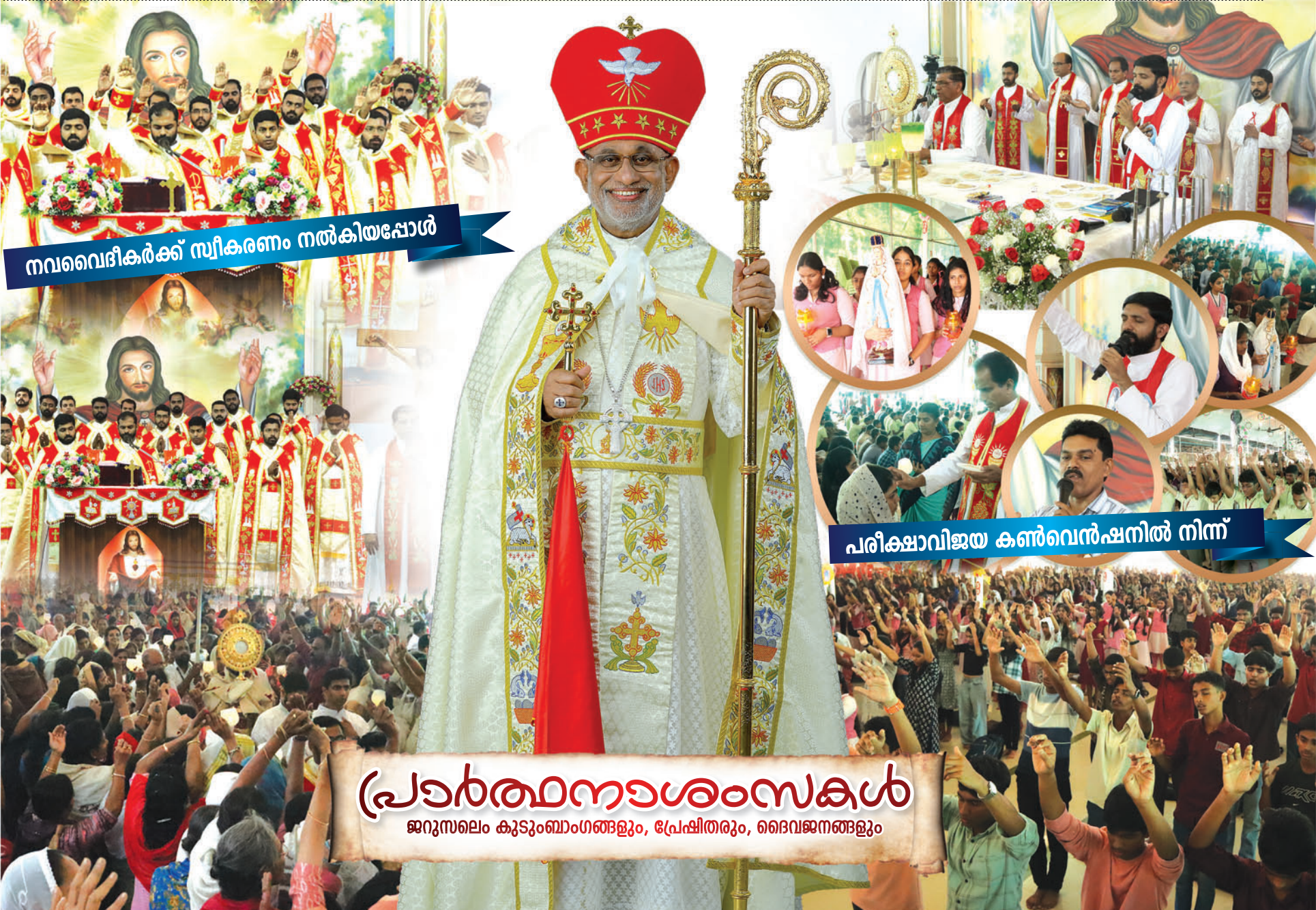
നവവൈദികർക്ക് സ്വീകരണം നൽകിയപ്പോൾ

തായി തിരുവചനം രേഖപ്പെടുത്തിയിരിക്കുന്നു. ചെറിയ കാര്യങ്ങൾ അനുസരിക്കാൻ സാധിക്കണമെങ്കിൽ ആഴമായ വിശ്വാസവും ആത്മീയ ശിഷ്യത്വവും വേണം. വിശ്വസ്തതയുള്ള ജീവിതപങ്കാളിയാകുക. വിശ്വസ്തതയുള്ള സ്നേഹിതനാകുക. വിശ്വസ്തതയുള്ള അയൽക്കാരനാകുക. വിശ്വസ്തതയുള്ള ജോലിക്കാരനാകുക. വിശ്വസ്തതയുള്ള ദാസനാകുക. ഉയർത്തപ്പെടുമ്പോഴും താഴ്ത്തപ്പെടുമ്പോഴും തിരസ്കരിക്കപ്പെടുമ്പോഴും സ്വീകരിക്കപ്പെടുമ്പോഴും അധികാരമുള്ളപ്പോഴും അത് നഷ്ടപ്പെടുമ്പോഴും രഹസ്യജീവിതത്തിലും പരസ്യജീവിതത്തിലും വിശ്വസ്തരാകുക. ഈ നോബ് കാലഘട്ടത്തിൽ മനുഷ്യരോടും ദൈവത്തോടും വിശ്വസ്തത പുലർത്തി ആത്മീയ നവീകരണത്തിന്റെ പുത്തനുണർവ്വ് സ്വായത്തമാക്കാൻ നിങ്ങൾക്ക് സാധിക്കട്ടെ. ഈശോ നമ്മെ നയിക്കട്ടെ. ആമ്മേൻ.