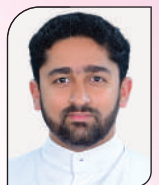
ഫാ. ജെയിൻ തോട്ടാൻ സെന്റ് സെബാസ്റ്റ്യൻ ചർച്ച് തൃന്യാക്കോട്