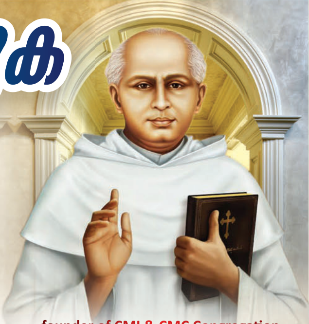
founder of CMI & CMC Congregation എല്ലാവർക്കും വിശുദ്ധ കുറാക്കോസ് ഏലിയാസ് ചാവറച്ചന്റെ തിരുനാൾ മംഗളങ്ങൾ

ജീവിതം വിജയകരമായിത്തീരാൻ പരസ്യമായ പ്രവൃത്തികൾ വേണമെന്നില്ല. രഹസ്യമായ വിശുദ്ധി മതി. ജീവിതം വിജയകരമായിത്തീരാൻ സമ്പത്ത് വേണമെന്നില്ല. സംതൃപ്തി മാത്രം മതി. എല്ലാവർക്കും നവ വത്സരത്തിന്റെ ആശംസകൾ.