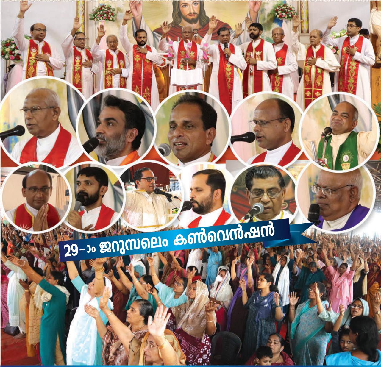
29-ാം ജനുസലേം കൺവെൻഷൻ

ആയിരങ്ങൾ ജപമാല കത്തിയിൽ വളർന്ന് വിശുദ്ധി നിറഞ്ഞ ജീവിതത്തിന് ഉടമകളാകുവാൻ മരിയൻ സഖ്യം നേതൃത്വം നൽകുന്ന ജപമാല നിർമ്മാണവും വിതരണവും