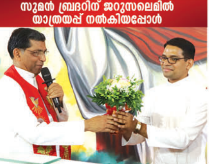
സുരൻ ബ്രദറിന് ജറുസലേമിൽ യാത്രയ്ക്ക് നൽകിയപ്പോൾ