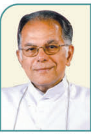
മാർ ജോസഫ് തുങ്കുഴി പിതാവിന്റെ മെത്രാൻപദവിയിലൂടെ അതുഗ്രഹിതരായ 50 വർഷങ്ങൾ